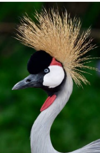
montuosa del Drakensberg

laghetto nel cratere. Arrivo in serata presso lo Endoro Lodge (o simile) immerso nel verde di un rigoglioso giardino sulle falde esterne del cratere, in prossimità della cittadina di Karatu. Cena e pernottamento.